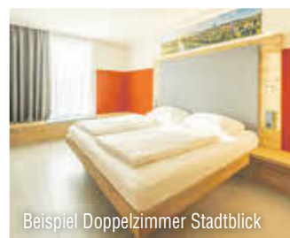
Beispiel Doppelzimmer Stadtblick

Weitere Termine und Informationen bzgl. Zuschlägen, zusätzlichen Zimmerkategorien, Inklusivleistungen, Kinderermäßigungen, Mitnahme von Hunden usw. finden Sie auf reisenaktuell.com . Mit Erhalt der Reisebestätigung wird eine Anzahlung in Höhe von 20 % des Reisepreises fällig. Die Restzahlung ist 30 Tage vor Abreise zu tätigen. Veranstalter: Reisen Aktuell GmbH, In den Weniken 1, 56070 Koblenz