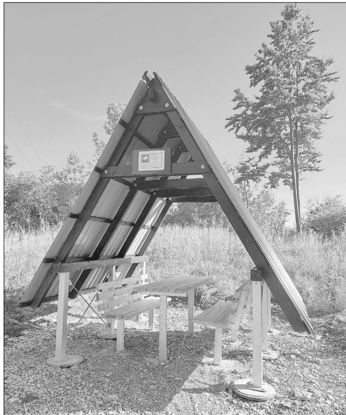
Sitzgruppe am Marterstein Ehnes

Übrigens, in den letzten Wochen wurde neben den erwähnten Sitzgruppen in der letzten Amtsblattausgabe auch am Marterstein in Ehnes eine neue Sitzgruppe von der Naturparkmeisterei aufgestellt. Der Kultur- und Heimatverein hat diese zusätzlich mit einem Dach ausgestattet und kümmert sich um die Pflege des Objektes.