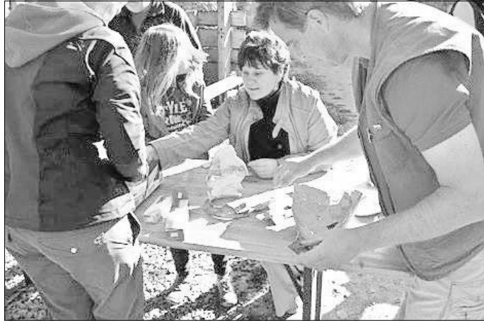
Archäologischer Tag Schaumburg