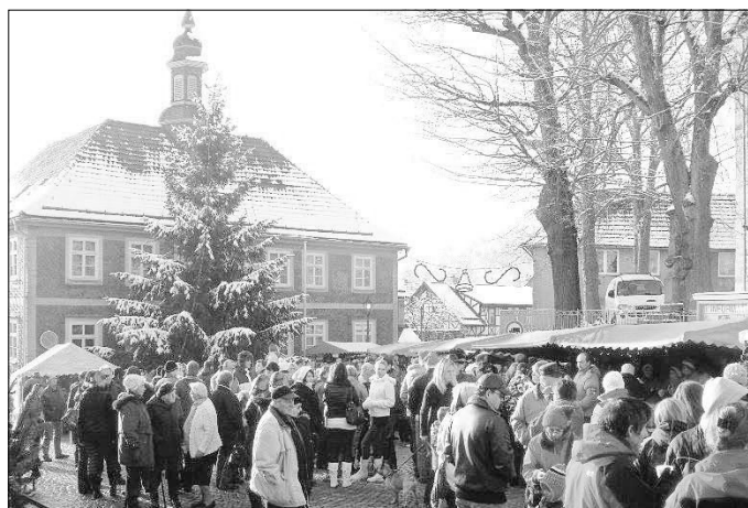
Weihnachtsmarkt vorm Rathaus

FW Fahrzeug Schalkau 321.558,23 € Gehwegbau / Straßenbel. Schaumbergstr. / Katzberger Str. 53.993,71 € Neugestaltung Marktplatz - Kirchhof 1. TBA 43.395,98 € Straßenbau/ Straßenbeleuchtung Brunnhügel 10.743,08 €