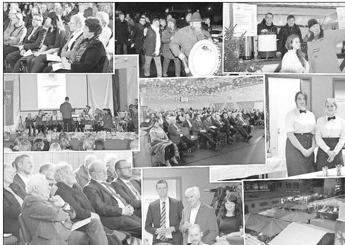
30 Jahre Grenzöffnung