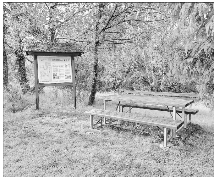
Unterwegs am Grünen Band in Görsdorf

Es laufen hierzu und generell zu den Wanderwegen auch schon Gespräche mit der Schalkauer Schulleitung. Aktuell überlegen die Stadt Schalkau und die Gemeinschaftsschule, wie das Thema Wanderwege in die Arbeit der Schule und des Unterrichts einbezogen werden könnte. Einige unserer Lehrer konnten hierzu bereits Erfahrungen in einem früheren Unterrichtsprojekt sammeln, die sicherlich sehr hilfreich eingesetzt werden können. Ansatzpunkte gäbe es viele. Egal welche Themen - ob Tiere und Pflanzen, Umweltbildung, die Geschichte des zweigeteilten Deutschlands entlang des Grünen Bandes oder unser Dialekt - der Blumenstrauß an Ideen ist groß und bunt. Jetzt liegt es daran diese gemeinsam zu besprechen und eine Kooperation zu schmieden.