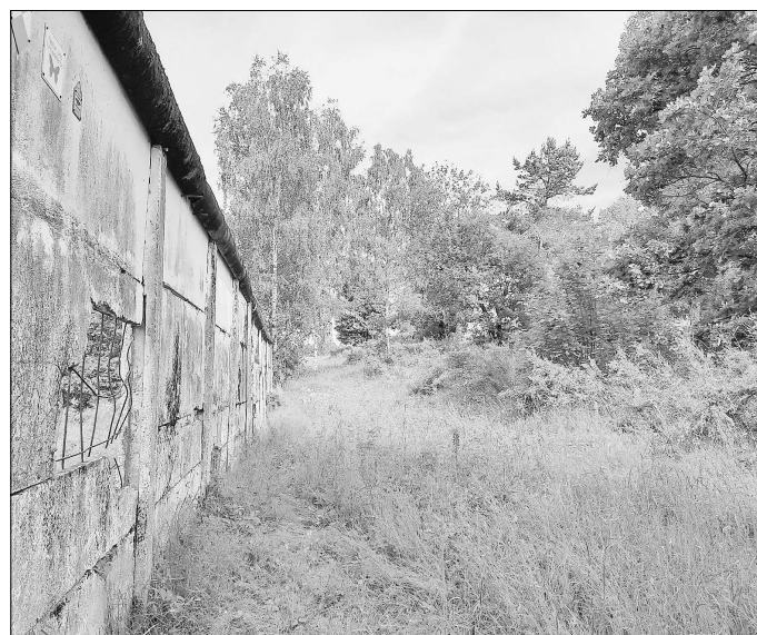
An der Görsdorfer Mauer