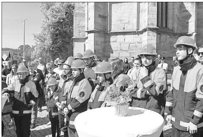
Auch die Jugendfeuerwehr Schalkau war dabei.