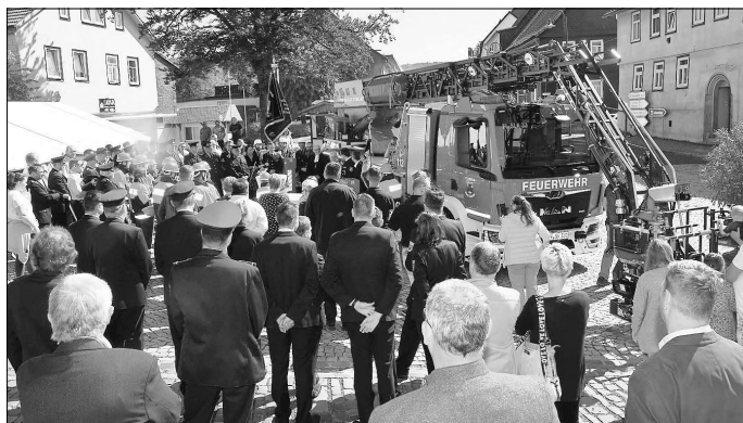
Die neue Drehleiter der Stützpunktfeuerwehr in Schalkau wurde im Rahmen eines Festgottesdienstes feierlich übergeben und in Dienst gestellt.

Nunmehr verfügen im Landkreis Sonneberg die Stützpunktfeuerwehren Steinach, Neuhaus am Rennweg und Schalkau über moderne Drehleiterfahrzeuge. Zeitnah soll noch für die Feuerwehr Sonneberg-Mitte ein ähnliches Einsatzfahrzeug beschafft werden, um in diesem Bereich im Kreisgebiet vollständig zeitgemäß aufgestellt zu sein.